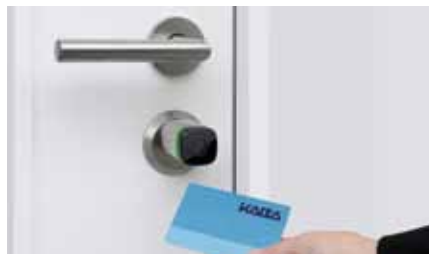
Cilindro digitale Kaba