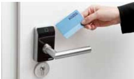
Kaba c-lever compact